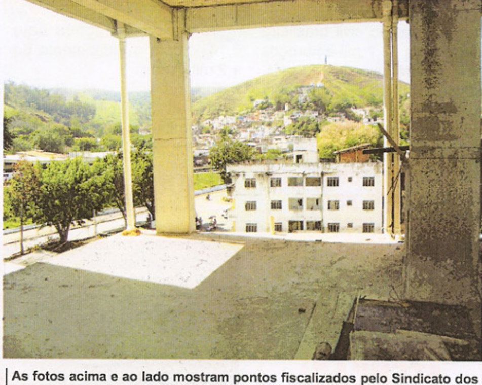
As fotos acima e ao lado mostram pontos fiscalizados pelo Sindicato dos Trabalhadores da Construção de Guaratinguetá em parceria com o Ministério do Trabalho e Emprego: várias obras foram embargadas em 2012

Essa tem sido uma ação rotineira entre as duas instituições, visando fiscalizar as condições de trabalho dos companheiros e companheiras da construção civil em toda a região.